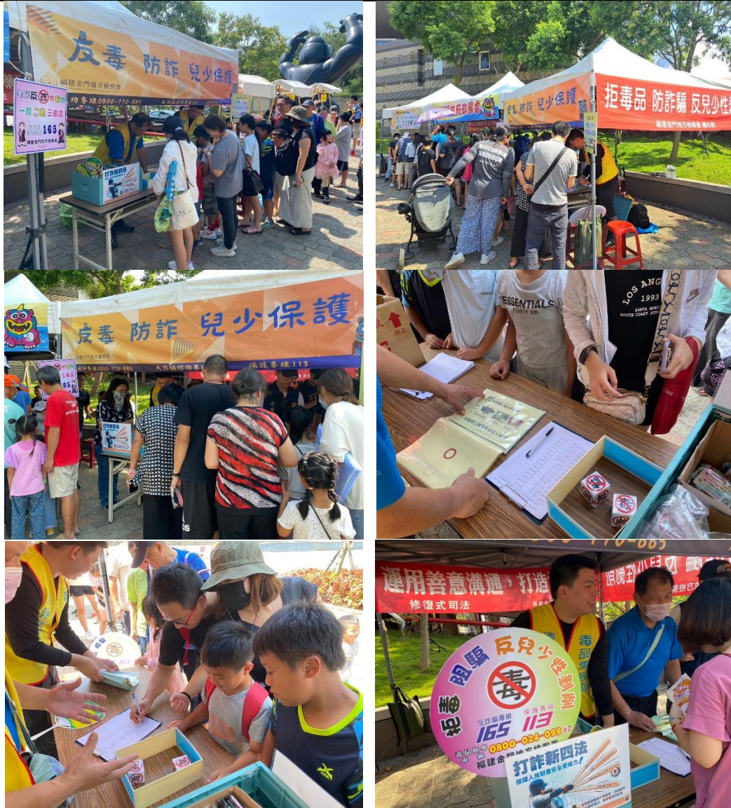
圖片說明：本署結合金門縣政府於8月31日舉辦的「金門親子嘉年華主活動日」於金湖綜合體育館設置攤位進行法治宣導。