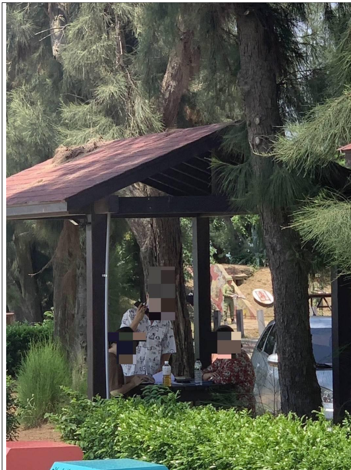
圖片說明：被告2人(左邊兩位)在金門縣烈嶼鄉某涼亭受理民眾(右)申辦中國移動公司門號。